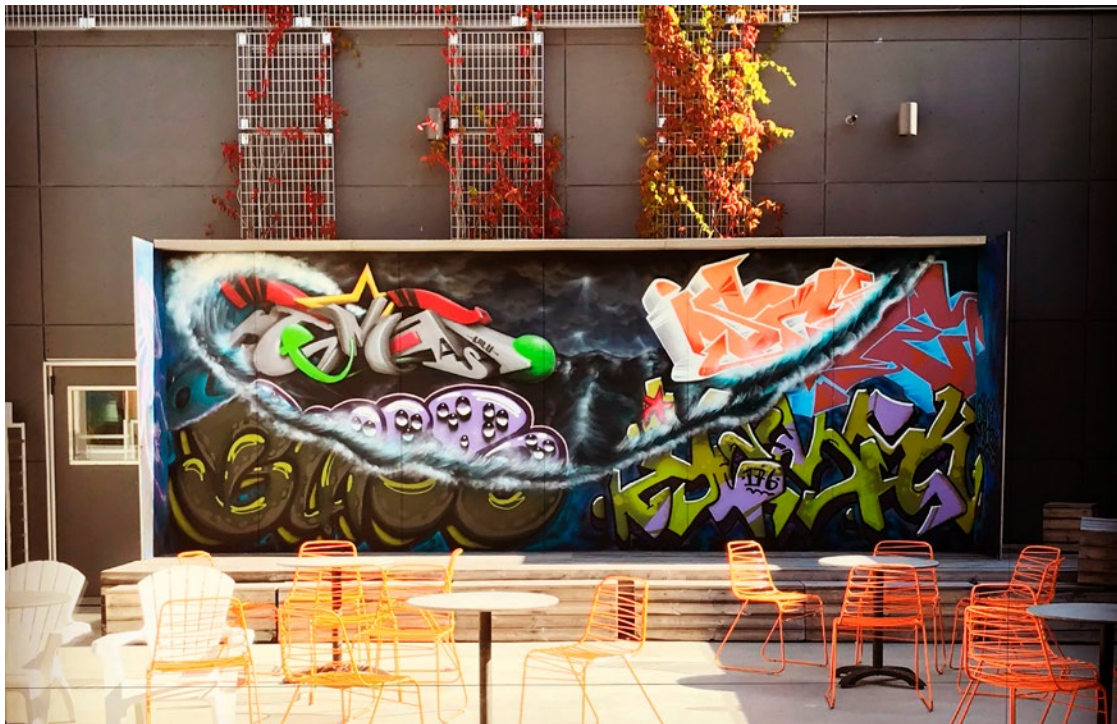
Konstväggen på Tegelbrukets innergård är ett av Sensus aktuella projekt.