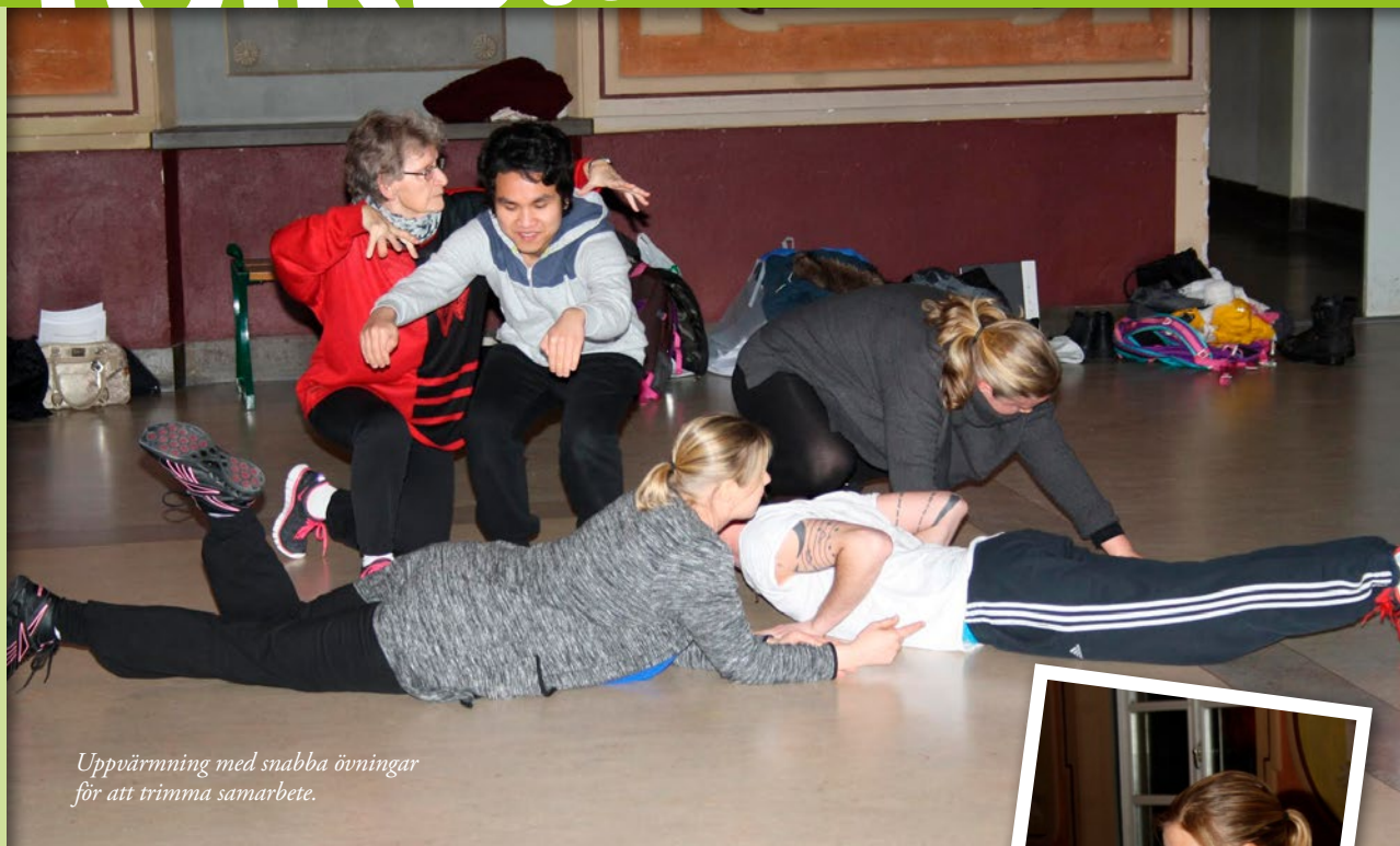
Uppvärmning med snabba övningar för att trimma samarbetet.