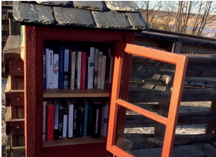
Bokholk vid Naturens hus som tillverkats av Trygve Persson.