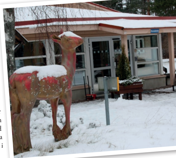
Huvudentrén till Fellingsbro folkhögskola.

Skolan var räddad och i januari 1984 invigs en ny skolbyggnad där den gamla nedbrända huvudbyggnaden en gång stod.