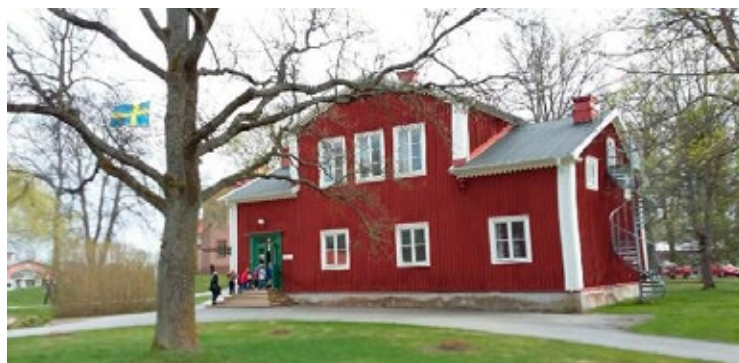
Ursprungsbyggnaden. 1878 flyttade skolan in i det här skolhuset som idag används som skolmuseum.

Det började med en vinterkurs för pojkar. Sju år senare infördes en sommarkurs för flickor. Idag är Kävesta folkhögskola en väletablerad utbildningsbas med kulturprofil, både för män och kvinnor, cirka två mil söder om Örebro. En av de äldsta folkhögskolorna i landet.